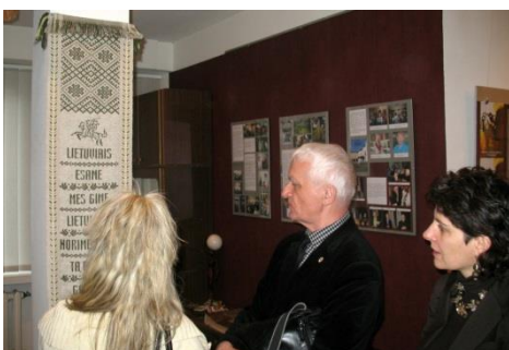
Svečiai iš Kaliningrado mokyklos muziejuje. Svečias nuotraukoje – žymus lietuviybės puoselėtojas Kaliningrade.